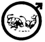
Tabla 2- Número de toros examinados en cada raza (1973-2024)