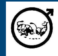
Tabla 3- Causas de rechazo en toros después de la revisión de 69.675 toros de carne entre los años 1973-2024