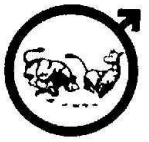
Tabla 6-Hallazgos en 34.595 toros de razas de carne luego de realizar la Prueba de C.S. (1973/2024)